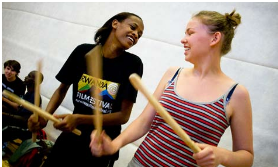
WORKSHOP med Mashirika på biennalen 2008