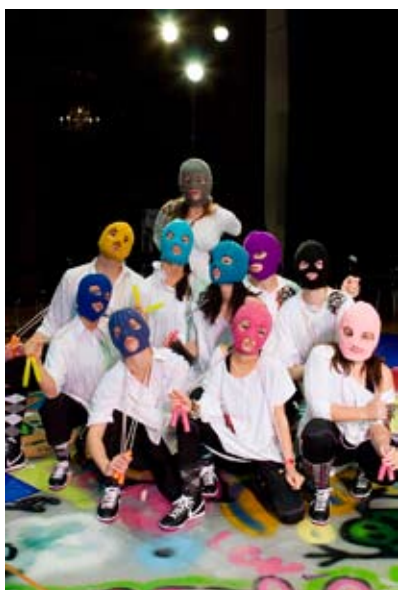
MADE IN SWEDEN med Dansstationens Turnékompani

Läs mer om delaktighetstemat i programkatalogen eller på www.bibu.se .