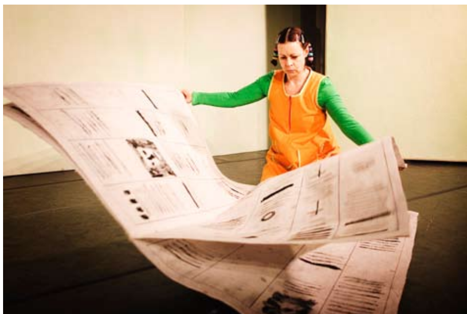
DANSA DINA DINOSAURIER med Månteatern