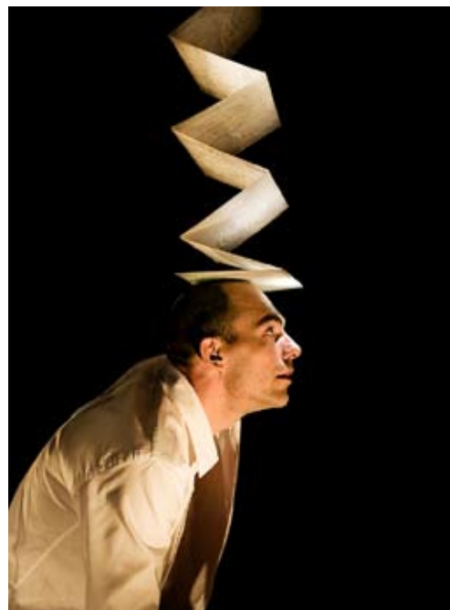
MID DIG OS med Åben Dans