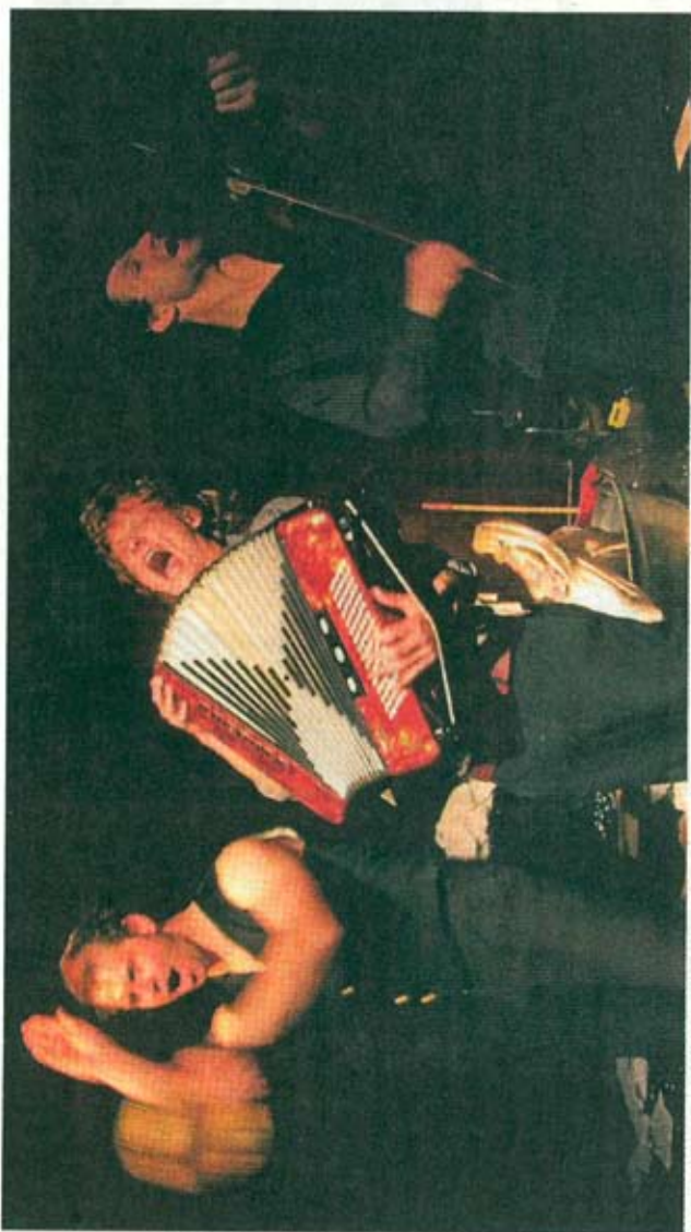
Teaterkompaniet NIE berättar, dansar, sjunger och gestaltar den europeiska historien på barnteaterfestivalen Bibu i Lund.