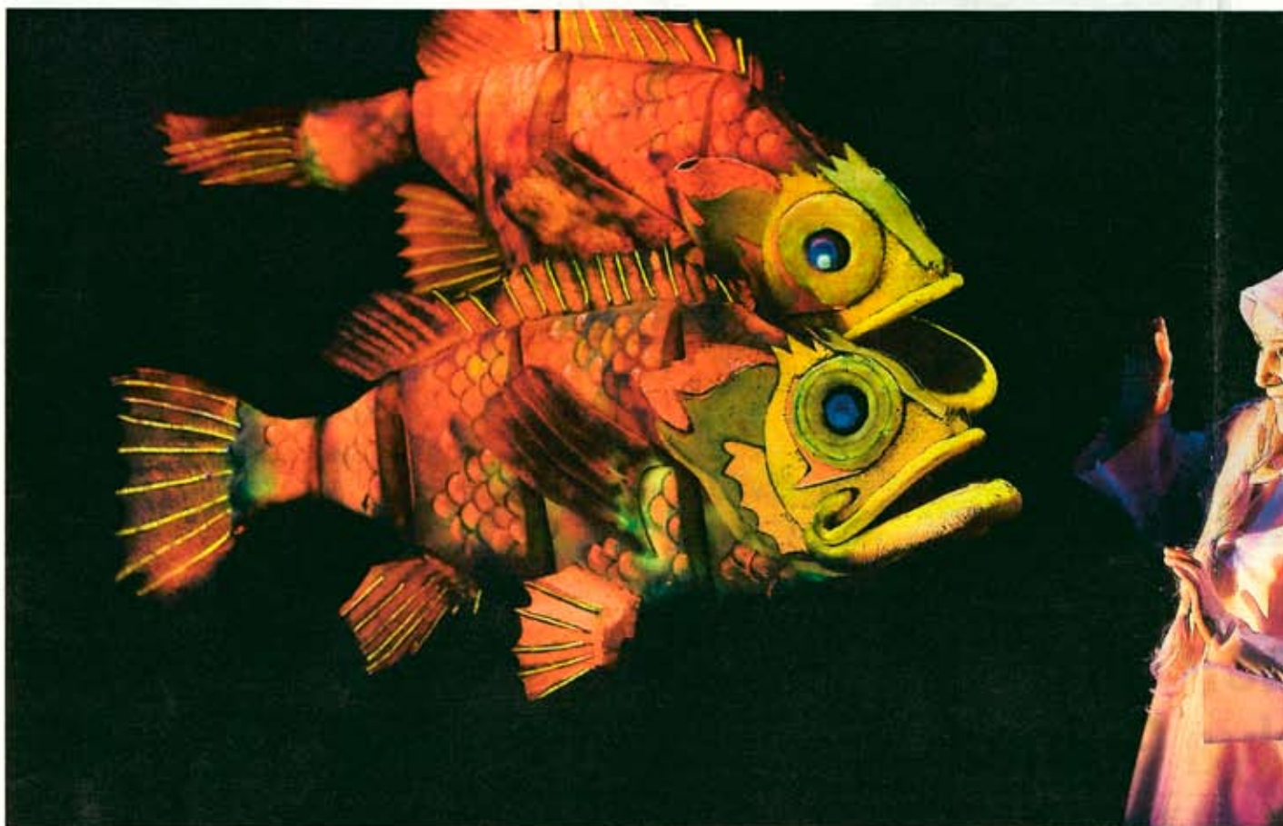
Pratsamma fiskar i Sindri Silfurfiskur spelad av Islands Nationalteater.