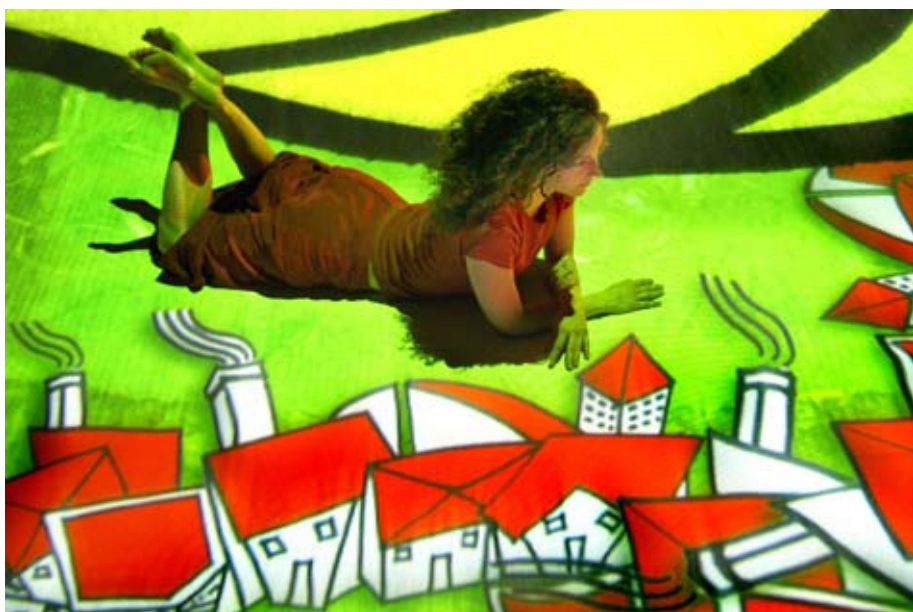
IL GIARDINO DIPINTO med TPO