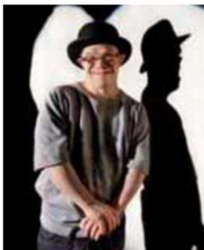
Byteatern i Kalmars "Att vara människa".