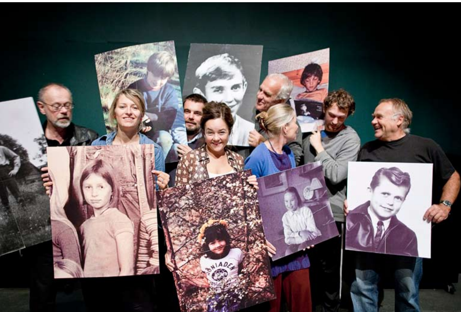
4018 DAGAR med Backateatern