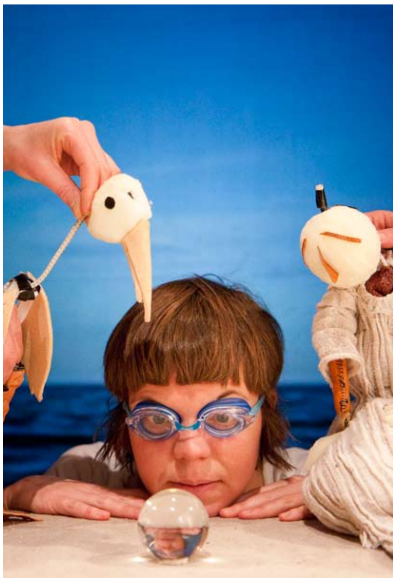
STRANDEN med ZeBU

En annan viktig faktor för festivalmixen är att Teatercentrum bjuder sina medlemmar på biennalpass och genom att förlägga sin årliga kongress i direkt anslutning till festivalen kan de även subventionera resekostnaderna. Frigruppernas ekonomiska möjligheter till fortbildning, resor, festivalbesök m.m. är i allmänhet mycket begränsade. Utan Teatercentrums insatser skulle sannolikt institutionernas medarbetare dominera starkt på biennialerna.