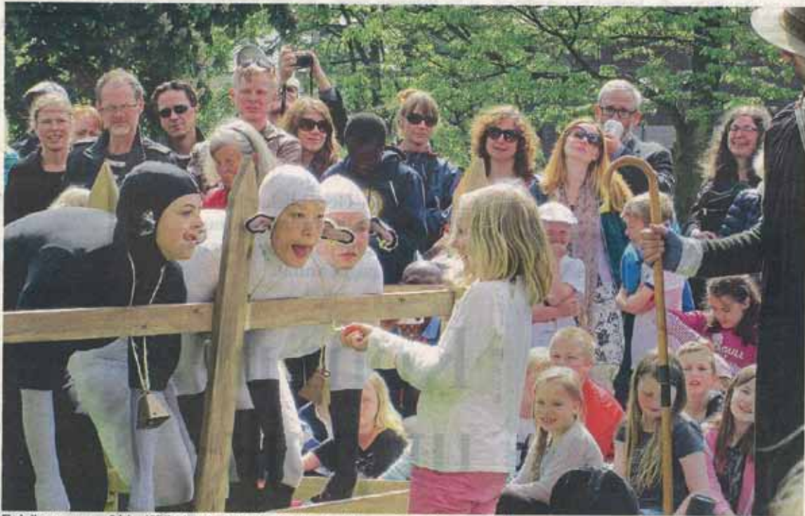
Färskallarnas sammansvärjning. I Biblioteksparken bråkade fären i den kanadensiska gruppen Corpus inför en stor publik.

HELSINGBORGS DAGBLAD, NORDVÄSTRA SKÅNES TIDNINGAR, LANDSKRONA POSTEN