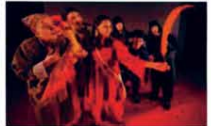
Den magiska fjädern med Riksteaterns Tysta Teater.