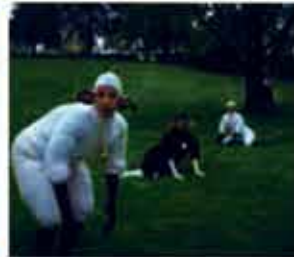
Les Moutons med kanadensiska Corpus.