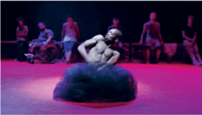
KILLAR ATT GILLA. Ur "Boys don't cry".